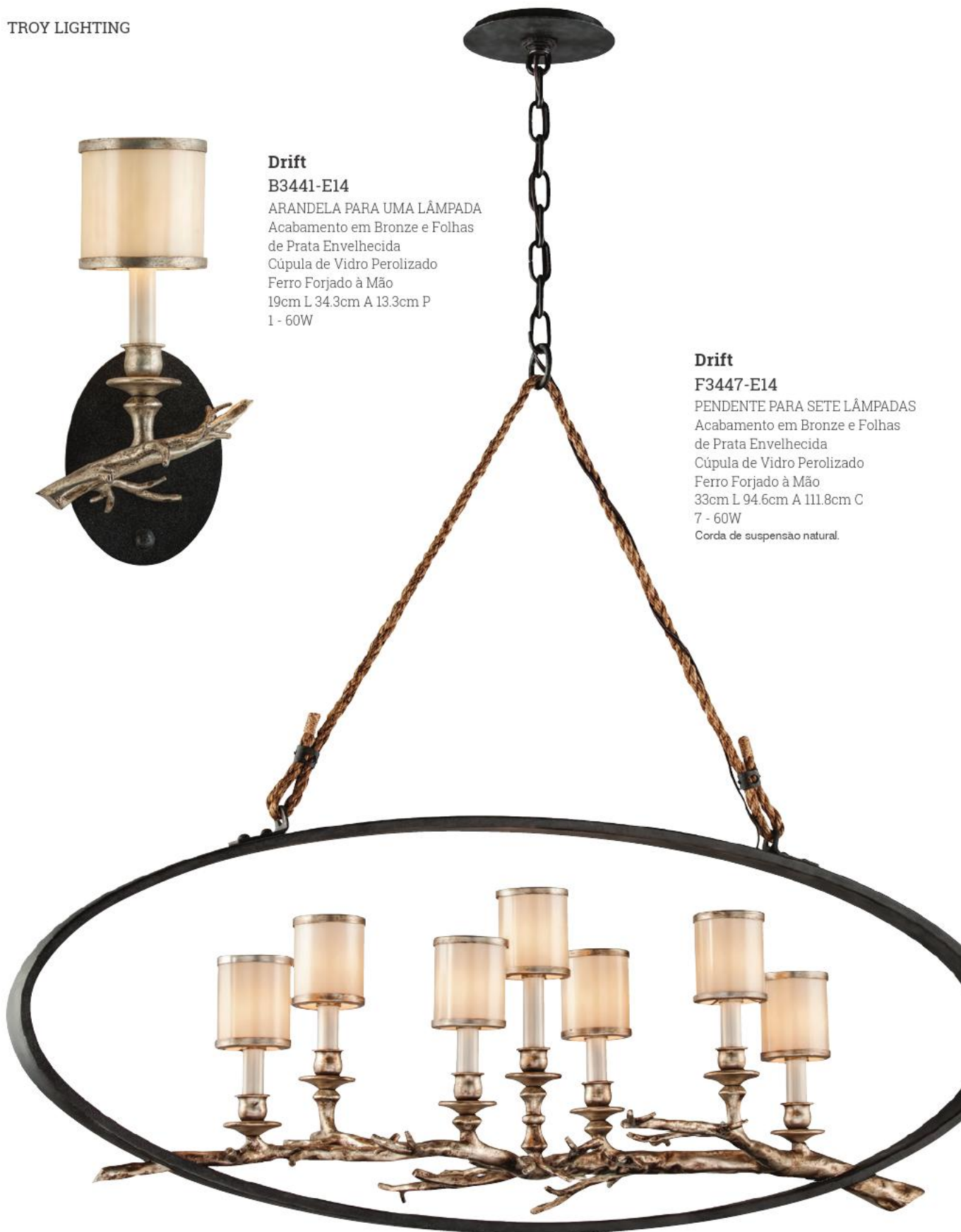
Drift F3447-E14 PENDENTE PARA SETE LÂMPADAS Acabamento em Bronze e Folhas de Prata Envelhecida Cúpula de Vidro Perolizado Ferro Forjado à Mão 33cm L 94.6cm A 111.8cm C 7 - 60W Corda de suspensão natural.