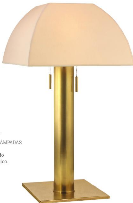
Alba BR-L246-AGB-E27 ABAJUR PARA DUAS LÂMPADAS Material: Aço AGB - Latão Envelhecido Cúpula de Papel Ecológico. 35.6cm L 66cm A 2 - 60W