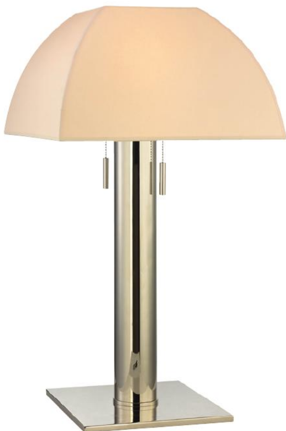
Alba BR-L246-PN-E27 ABAJUR PARA DUAS LÂMPADAS Material: Aço PN - Níquel Polido Cúpula de Papel Ecológico 35.6cm L 66cm A 2 - 60W