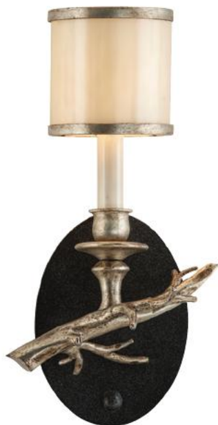
Drift B3441-E14 ARANDELA PARA UMA LÂMPADA Acabamento em Bronze e Folhas de Prata Envelhecida Cúpula de Vidro Perolizado Ferro Forjado à Mão 19cm L 34.3cm A 13.3cm P 1 - 60W