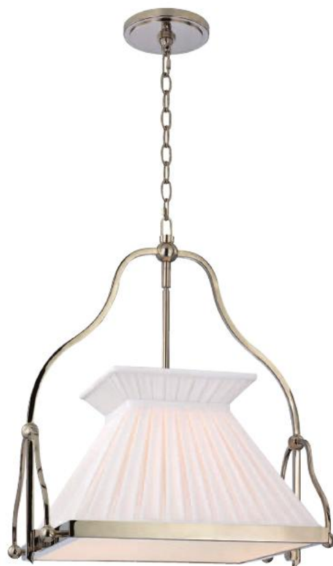
HUDSON VALLEY CLIFTON BR-4514-PN-E27 Lustre Pendente para Uma Lâmpa Feito de Aço PN - Níquel Polido Cúpula Rígida de Tecido de Seda f 30cm L 35cm C 46cm A 1 - 75W Haste de 11cm inclusa