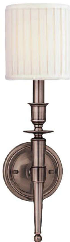
HUDSON VALLEY ABINGTON BR-4901-AN-E14 Arandela para Uma Lâmpada Feito de Latão AN - Niquel Envelhecido Cúpula Branca de Seda Falsa 12cm L 46cm A 14cm E 1 - 60W