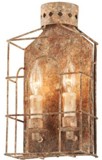
TROY JASPER B3502-E14 Arandela para Duas Lâmpad Ferro Forjado à mão Acabamento Ferrugem Coste 19cm L 36cm A 11cm P 2 - 60W