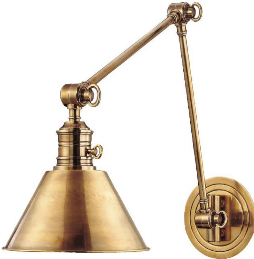
HUDSON VALLEY GARDEN CITY BR-8323-AGB-E27 Arandela para Uma Lâmpada Feito de Latão AGB - Latão Envelhecido 20cm L 42cm A 84cm E 1 - 75W