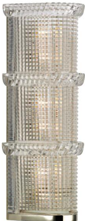
HUDSON VALLEY BLYTHE BR-5993-PN-G9 Arandela para Três Lâmpadas Feito de Aço Zincado PN - Níquel Polido Vidro Prismático 14cm L 34cm A 11cm E 3 - 50W G9 Xenon