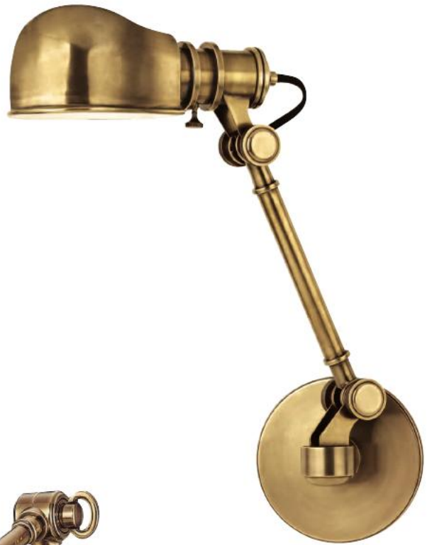
HUDSON VALLEY LACONIA BR-3941-AGB-E27 Arandela para Uma Lâmpada Feito de Latão AGB - Latão Envelhecido 14cm L 43cm A 43cm E 1 - 60W