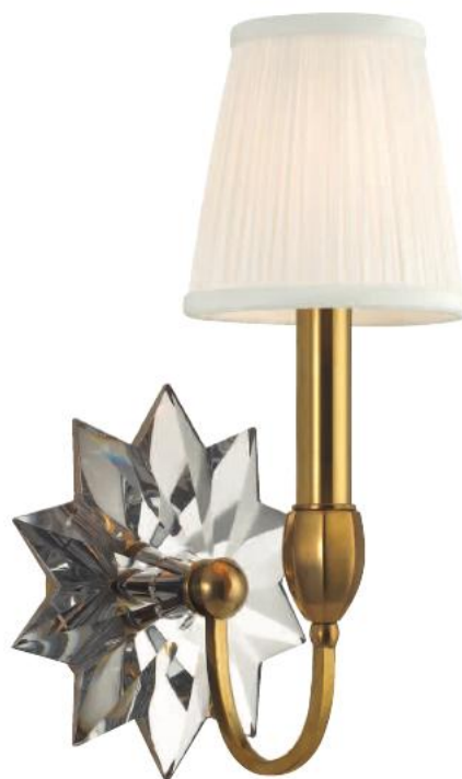
HUDSON VALLEY BARTON BR-3211-AGB-E14 Arandela para Uma Lâmpada Feito de Latão AGB - Latão Envelhecido Cúpula de Seda 18cm L 34cm A 18cm E 1 - 60W