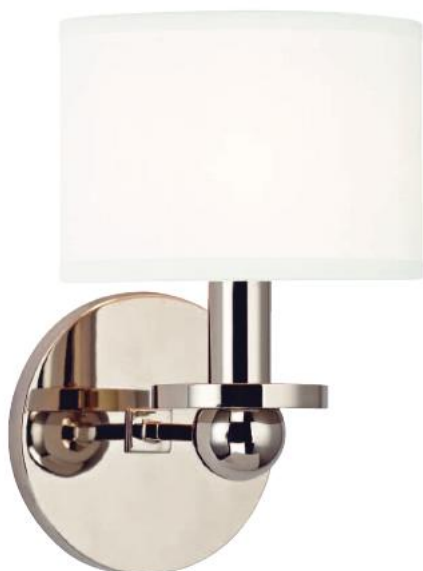
HUDSON VALLEY KIRKWOOD BR-1511-PN-WS-E14 Arandela para Uma Lâmpada Feito de Aço Zincado PC - Acabamento Cromado Cúpula de Seda Falsa Branca 14cm L 23cm A 17cm E 1 - 60W