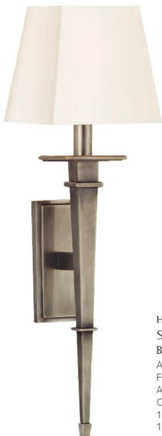
HUDSON VALLEY STANFORD BR-230-AS-WS-E14 Arandela para Uma Lâmpada Feito de Latão AS - Prata Envelhecida Cúpula de Seda Falsa Branca 16cm L 59cm A 17cm E 1 - 60W