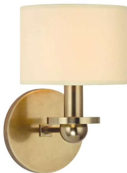
HUDSON VALLEY KIRKWOOD BR-1511-AGB-E14 Arandela para Uma Lâmpada Feito de Aço Zincado AGB- Latão Envelhecido Cúpula de Seda Falsa 14cm L 23cm A 17cm E 1 - 60W