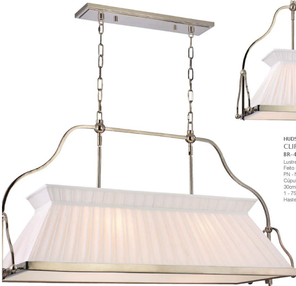
HUDSON VALLEY CLIFTON BR-4540-PN-E27 Lustre Pendente para Quarto Lâmpadas Feito de Aço PN - Níquel Polido Cúpula de Seda Falsa Branca 41cm L 102cm C 60cm A 4 - 60W Haste de 25cm inclusa